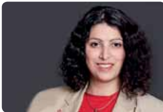
Diana Liberova, Stadträtin der SPD

An einem Tag im Juni durfte ich im Rahmen der Aktion Rollentausch im Pflegeheim Seepark Mögeldorf aushelfen. Die Vorurteile gegenüber der Altenpflege sind groß und deswegen versuche ich immer wieder mich selbst von der Qualität einzelner Einrichtungen zu überzeugen. Die Anlage Seepark bietet viele Möglichkeiten, so wird nicht nur ein Pflegeheim, sondern auch ein weiterer Teil mit dem Angebot des Service Wohnens betrieben.