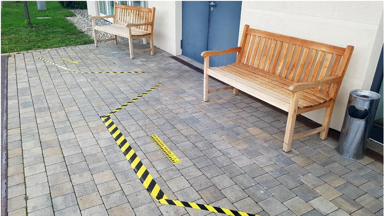
Außenbereich Eingang Pflegeheim